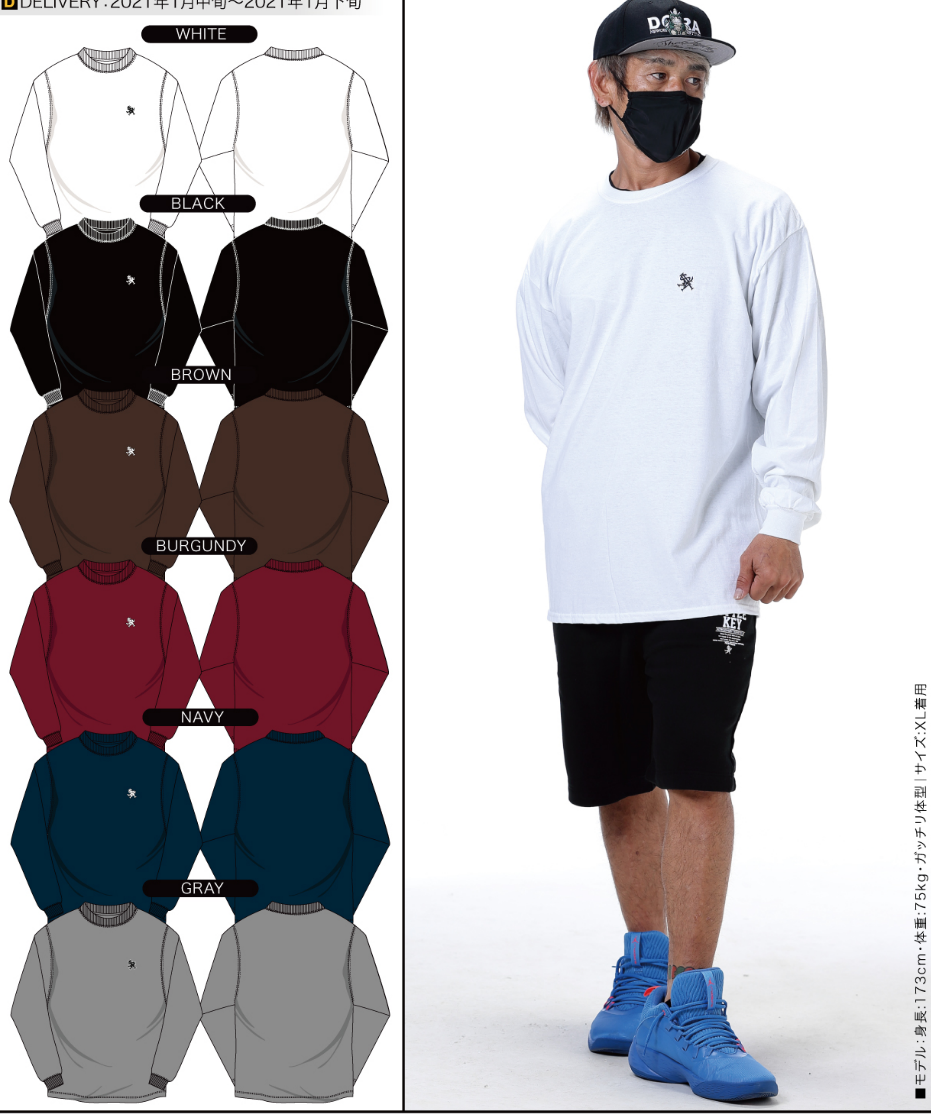
※上記表は予定上がり寸です。サイズは 製品ごとに若干の誤差が生じます。 予めご了承ください。